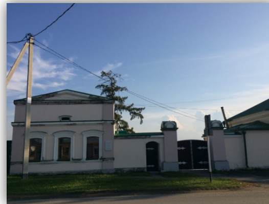
Здание библиотеки. В настоящее время воскресная школа