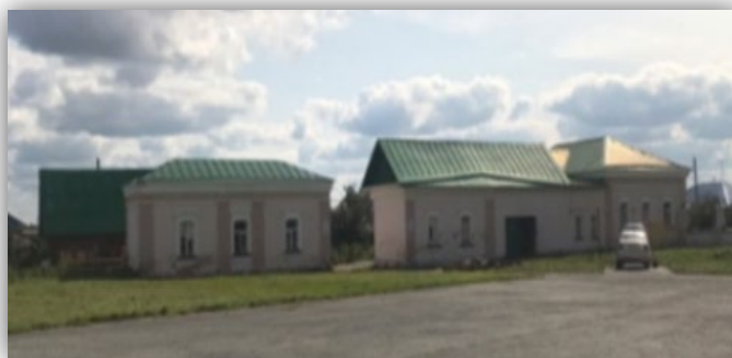
Здание гостиницы и столовой