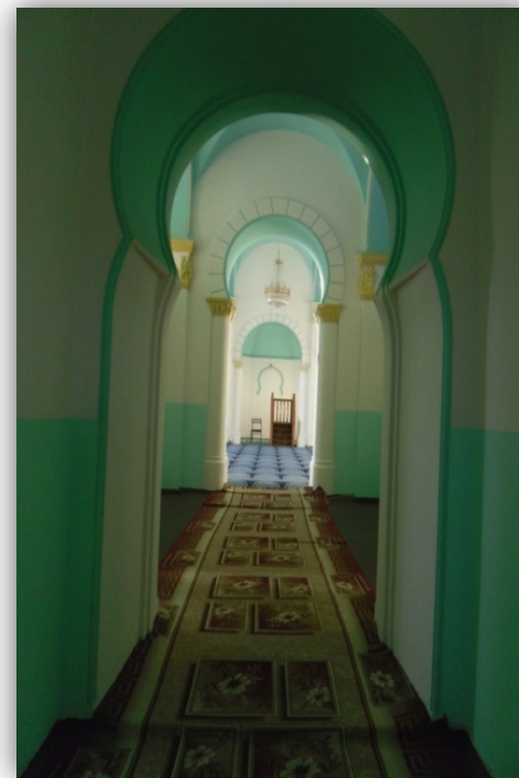
Ембаево. 2020. Собрание музея.