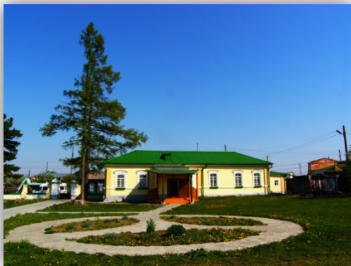
Здание медресе, Магометанского Духовного училища. Ныне Ембаевский сельский музей

Ансамбль Большой мечети- объект культурного наследия регионального значения. Годы строительства: 1881-1888.