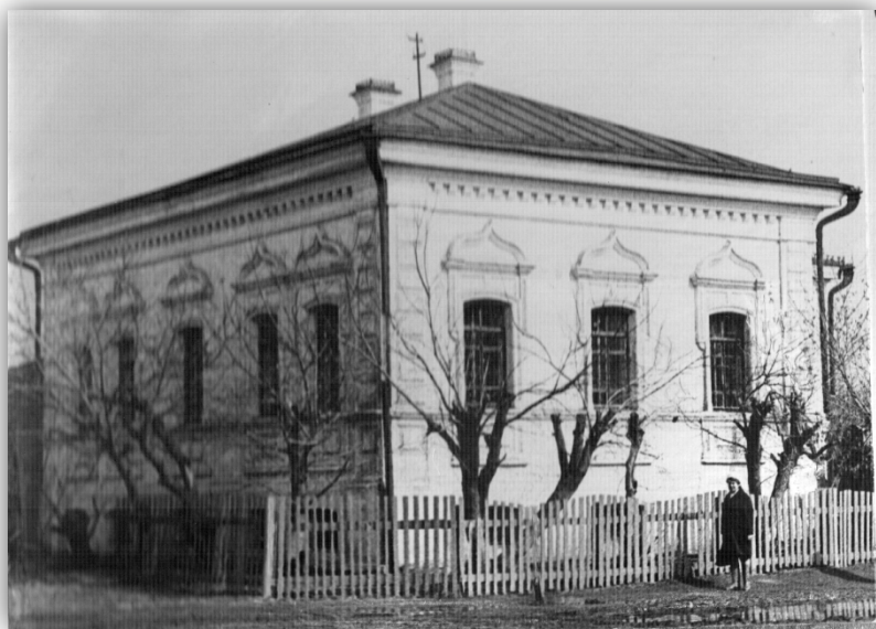
Дом Ю. Сагитова. 1965. Собрание музея