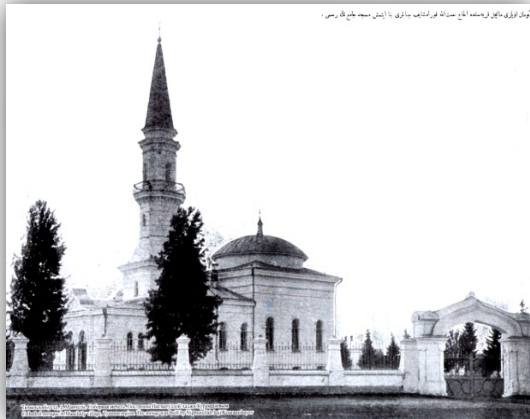
Ембаево. 1926. Собрание музея