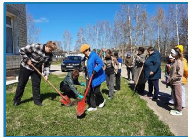
Трудовой десант (родители и дети)