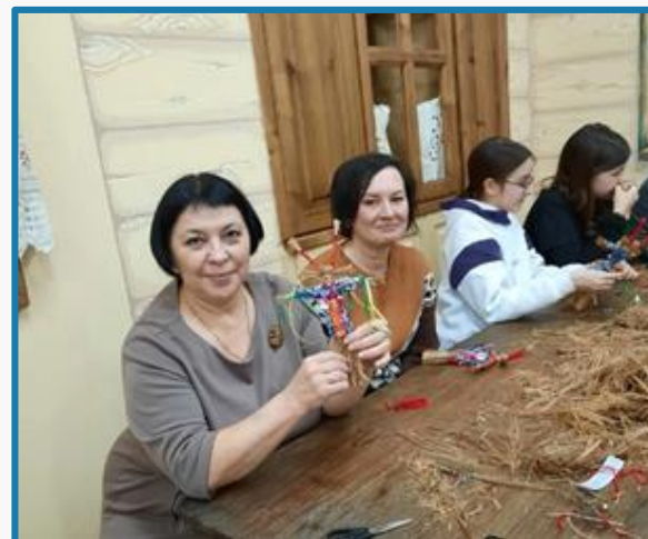
Рождественские мастер-классы с родителями