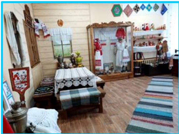
Музейная комната «Русская изба»